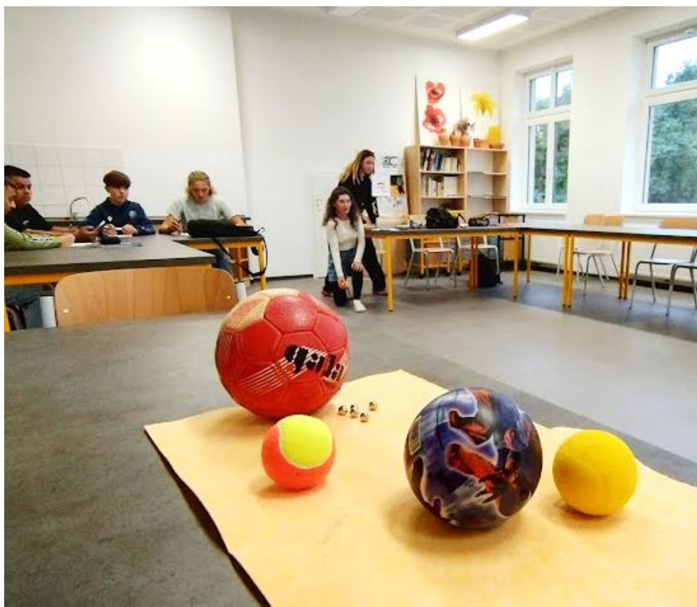
Obrázky: Z nového školního prostoru