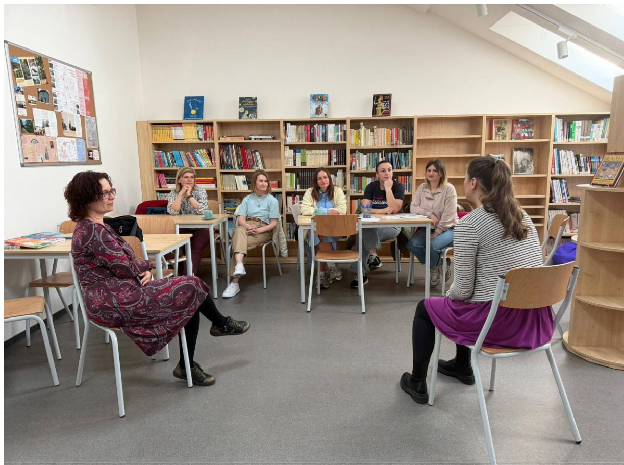
Foto níže: Ve školní knihovně proběhla Kavárna pro rodiče s tématem čtenářství. Připravily ji Adéla Lazárková a Kateřina Růtová.